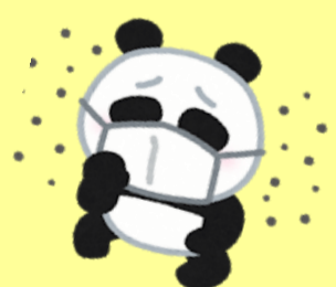
福島県内の発生状況